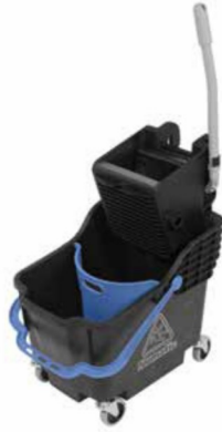
ComCar 1G (HB1812)