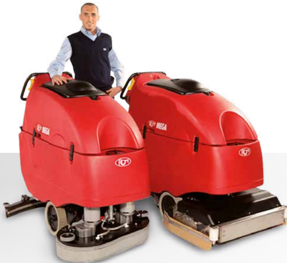
MEGA II lavante scrubbing fregadora