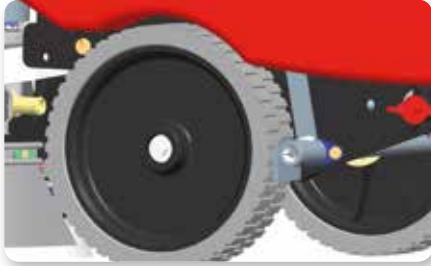
Freno stazionamento Parking brake Caja