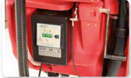
Carica batterie on board On-board battery charger Cargador de batería incorporado