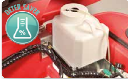
Dosatore detergente on board On board detergent dosing system Dosificación detergente a bordo