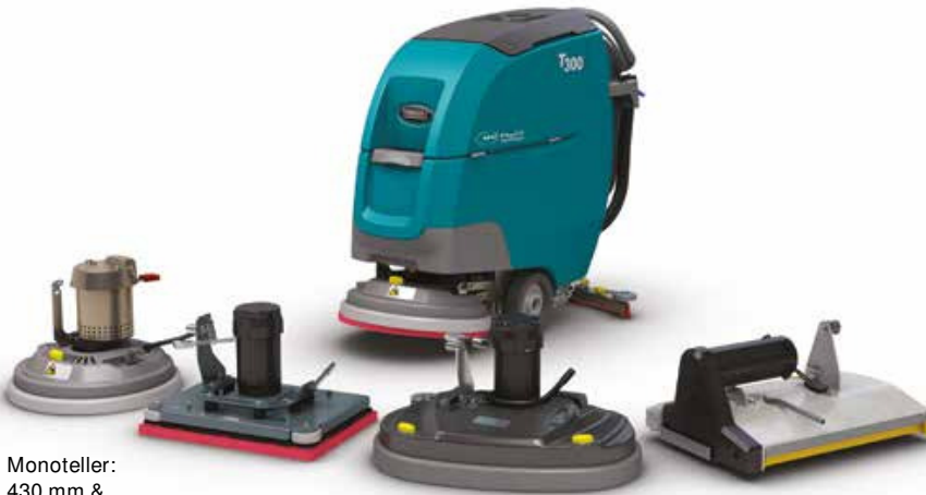
Monoteller: 430 mm & 500 mm

Die T300 Scheuersaugmaschine gibt es mit unterschiedlichen Typen von Schrubbköpfen, die auf Ihre Reinigungsanforderungen zugeschnitten sind und die Reinigungsleistung optimieren.