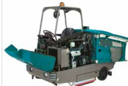
Das Design für einen einfachen Zugriff